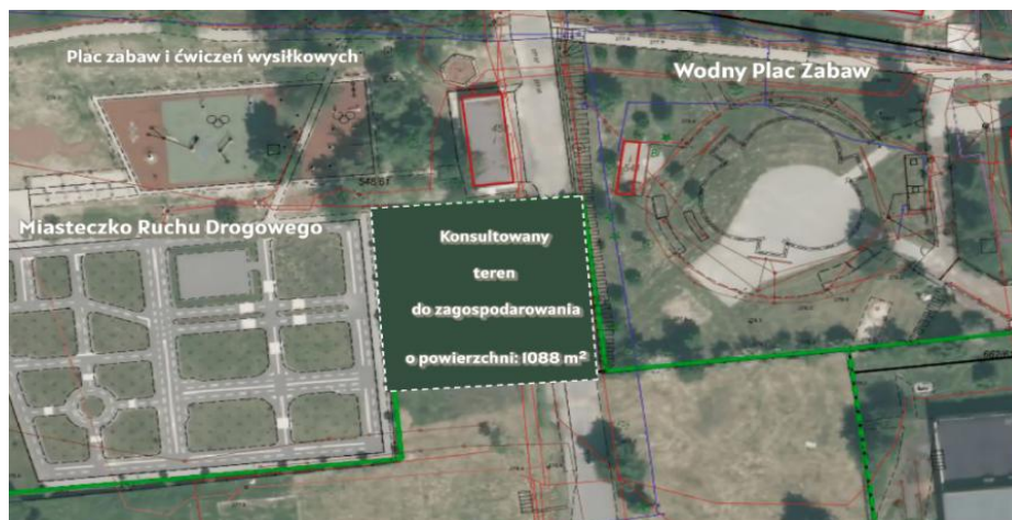
Mapka z lokalizacją działki zakupionej przez Gminę Pawłowice.