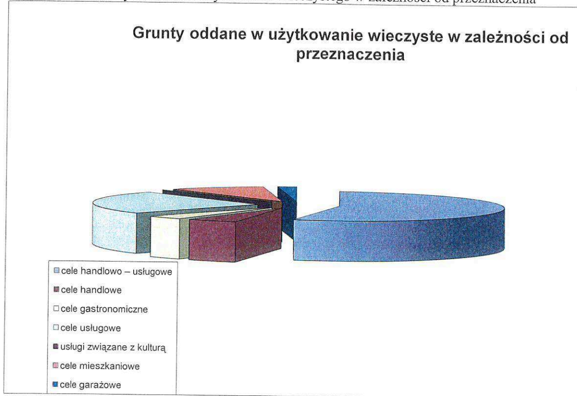
Wykres nr 2. Grunty oddane do użytkowania wieczystego w zależności od przeznaczenia