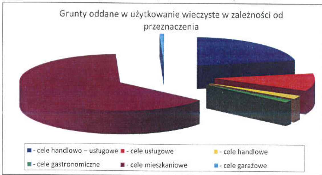
Wykres nr 2. Grunty oddane do użytkowania wieczystego w zależności od przeznaczenia