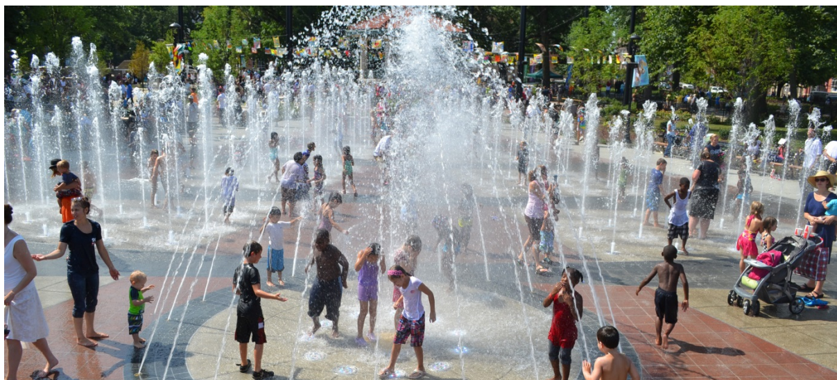
Zdjęcie.3 Dziecięca fontanna – przykład „Interaktywny Park Wodny w Waszyngtonie”